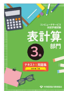
3級表計算部門 1,650 円(税込)