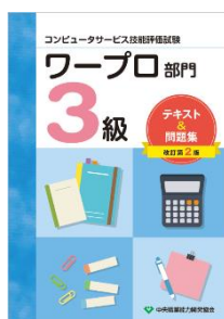
3級ワープロ部門 1,650 円(税込)