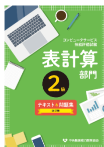
2級表計算部門 1,870 円(税込)