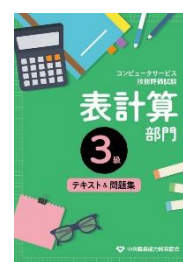
3級表計算部門 1,540 円(税込)