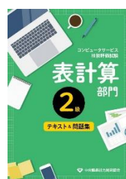
2級表計算部門 1,760 円(税込)